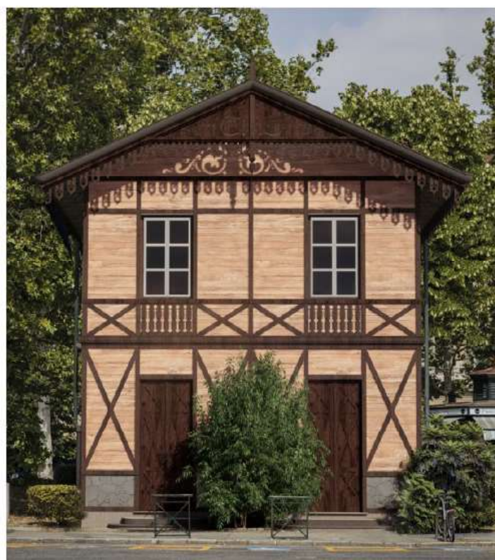
Figura 3 a. Ortofoto de una de las fachadas de Villino Caprifoglio antes de las obras de restauración (febrero de 2023). Figura 3 b. En la imagen izquierda la restitución gráfica de las obras de restauración en la misma elevación (octubre 2023). Estudiantes, docentes y técnicos del Politécnico de Turín efectuando pruebas con la cámara termográfica en la fachada del palacio que se asoma al sur, otoño 2016.